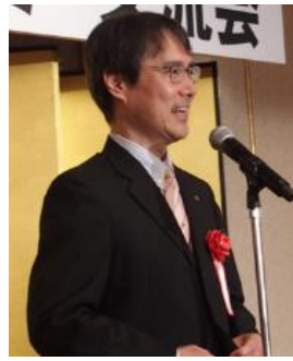
京都市 副市長 岡田憲和様