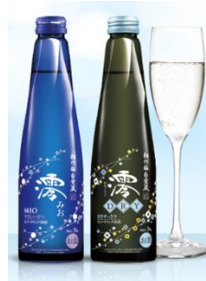
松竹梅 白壁蔵 濡/ 濡DRY