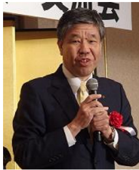
京都府 副知事 山下晃正様