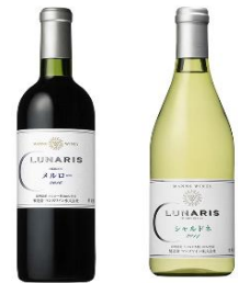
キッコーマン様ご提供 マンズワイン リュナリス メルロー/シャルドネ