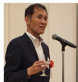
乾杯のご発声 農林水産省近畿農政局 局長 出倉 巧一 様