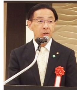
京都府 知事 西脇 隆俊 様